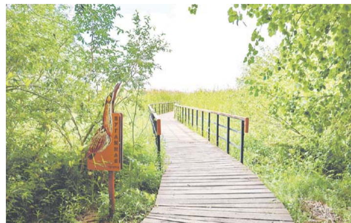
Бугайная тропа на Северном побережье Невской губы

Именно при Александре Беглове приняла первых посетителей поликлиника № 125 в Приморском рай-