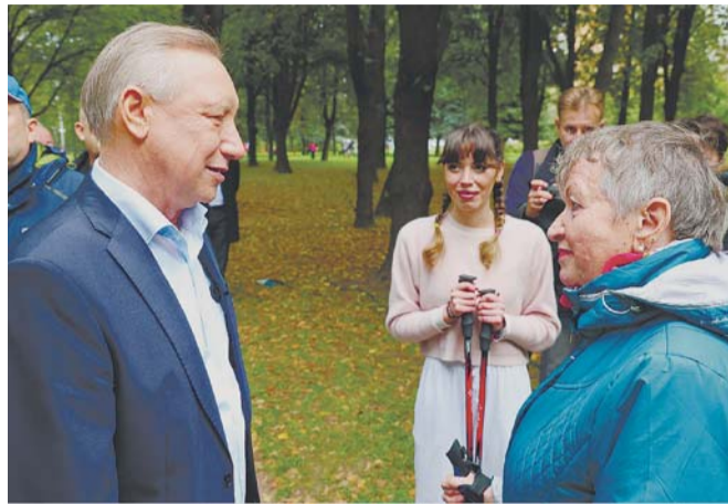
Губернатор Александр Беглов на открытии после реконструкции парка Авиаторов

где из-за исторически плотной застройки в жаркий день спасительную тень еще поискать надо.